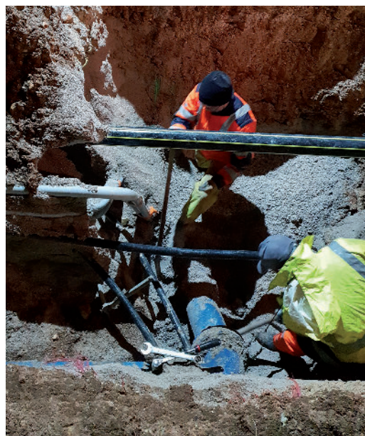
L'amélioration du réseau et des canalisations, une préoccupation permanente des agents du service de l'eau.

Pour faire face à cette activité croissance, l'usine de l'eau (qui a bénéficié de travaux sur sa toiture) a dû procéder à l'extension de ses bureaux. Dans deux ans, la prise de la compétence assainissement par la Communauté de Communes sera une nouvelle étape dans la montée en puissance d'un service essentiel aux habitants, tant l'eau est devenu un enjeu majeur pour la collectivité.