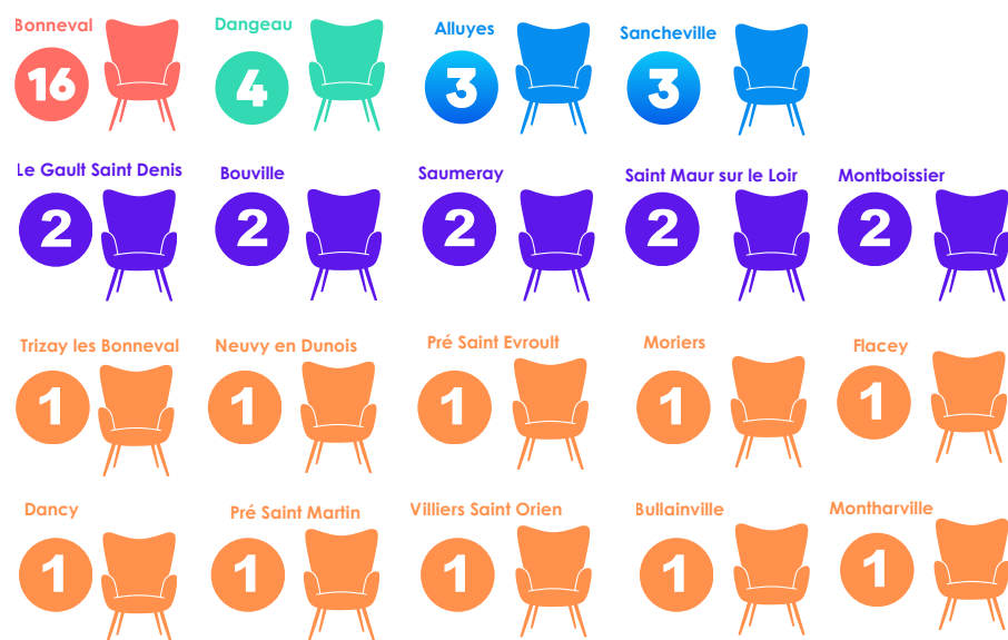
Chaque commune est représentée au Conseil Communautaire. Il y a au total 45 membres.