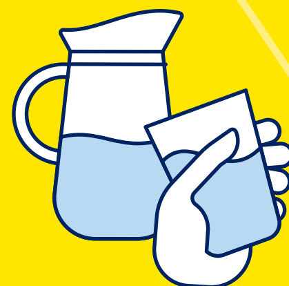
BUVEZ DE L'EAU